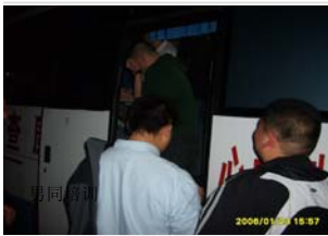
男同性恋酒吧采血现场