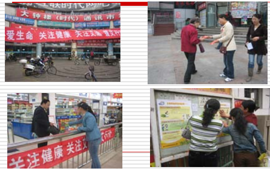
援艾志愿者小组在时代广场宣传