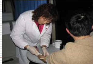
男性同性恋活动场所流动采血车现场采血