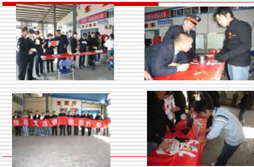
红丝带志愿者小组在火车站宣传