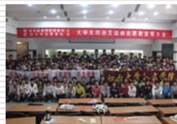
大学生防艾志愿者宣誓大会