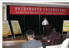
大学生志愿者在校园巡回演讲