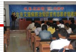
大学生志愿者防艾知识培训